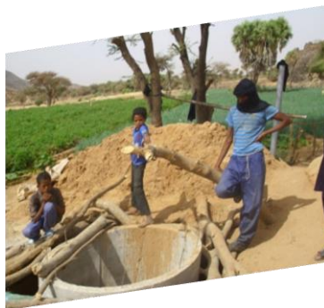
14 puits consolidés pour irriguer régulièrement les cultures