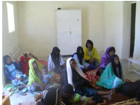
Assemblée très attentive !