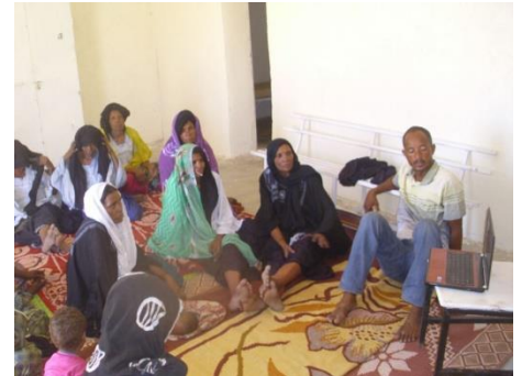
Matériel pédagogique moderne !

2 ème étape : durant 1 mois, ces 10 femmes ont organisé 4 « causeries » auprès des autres femmes du village