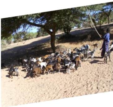
des chèvres : lait, fromage, viande