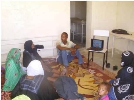
Comment se laver efficacement les mains ?

1 ère étape : 4 jours de formation par l'agent de santé d'Egandawel